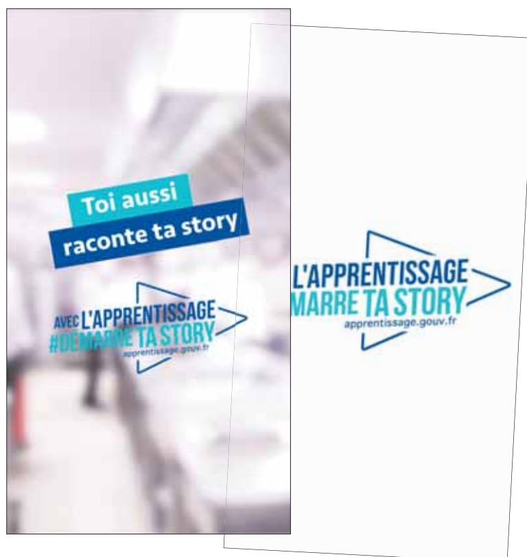
Images de début et de fin.