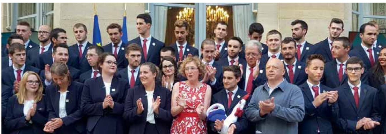
Muriel Pénicaud, en présence de Thierry Marx, apportant son soutien à l'équipe de France des métiers avant sa participation aux Worldskills, le 30 août 2017